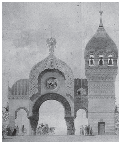
Entwurf zu einem Stadttor von Kiew von Viktor Hartmann

Phantasien als Hommage an einen Vertreter der Bildenden Kunst, aber auch als Zeugnis eigener, freier und vom ursprünglichen Thema durchaus abschweifender Fantasie. Musikalische Miniaturen, die von wilder Expressivität und schwerer Melancholie ebenso geprägt sind wie von realistischer Detailtreue. Mussorgsky selbst nannte seinen Zyklus eine »Albumserie über den genialen Architekten Hartmann« (gewidmet war sie Stasow).