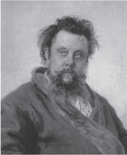
Porträt Mussorgskys kurz vor seinem Tod, gemalt von Ilja Repin (1881)

Modest Mussorgsky hinterließ nur eine Handvoll größerer Orchesterwerke, und zwei davon sind eigentlich nur in Bearbeitungen anderer Komponisten populär geworden. Neben der von Nikolai Rimsky-Korsakow überarbeiteten Phantasie Eine Nacht auf dem kahlen Berge sind es vor allem die von Maurice Ravel orchestrierten Bilder einer Ausstellung , die Mussorgsky 1874 als Zyklus für Klavier angelegt hatte. Diese wurde zu Lebzeiten des Komponisten weder öffentlich aufgeführt noch publiziert; erst 1876, fünf Jahre nach Mussorgskys Tod, kamen sie in einer überarbeiteten Fassung ans Licht der Öffentlichkeit, wurden aber auch danach fast nie im Konzert gespielt – bis Ravels Orchesterfassung die musikalischen